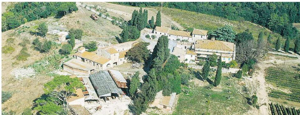
Una veduta dall'alto della fattoria di Paltratico (foto d'archivio)

Attualmente la fattoria di Paltratico è un'azienda agricola che produce olio e vino. La variante non riguarda la totalità del progetto previsto per il recupero di Paltratico, ma soltanto il comparto turistico ricettivo di eccellenza, quello che comprende la realizzazione di piscina, centro benessere e beauty farm. «Il progetto prevede - dice Pia - un pacchetto che rientra nell'ambito agrituristico: 76 posti letto, oltre a una cantina tra le vigne, sala conferenze e spazio enoteca-degustazione. Per questo intervento la proprietà non aveva necessità di richiedere varianti, dato che è previsto dalle normative vigenti». La srl Fattoria di Paltratico ha però previsto il totale recupero degli edifici esistenti nel borgo, e la realizzazione di un secondo tipo di struttura ricettiva, con tanto di piscina, centro benessere e beauty farm.