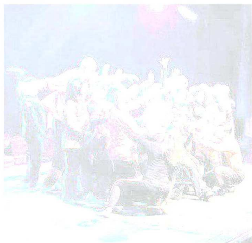
Un momento dello spettacolo "Andata e ritorno" al teatro Ordigno

Publicato sul sito del Comune l'avviso esplorativo, non vincolante, relativo all'individuazione di aree ed immobili nel Comune di Rosignano Marittimo per l'attrazione di investimenti. L'amministrazione fa sapere che l'avviso resterà sempre aperto, tuttavia la prima scadenza per l'individuazione dei pacchetti localizzativi è fissata per il 31 dicembre. «Il Comune - si legge in una nota - intende rafforzare il sistema economico del territorio attraverso la predisposizione di un pacchetto localizzativo finalizzato all'attrazione di investimenti dall'esterno. L'avviso costituisce un'indagine conoscitiva finalizzata a rilevare le informazioni relative alla disponibilità di aree ed edifici a destinazione industriale, produttiva, direzionale presenti nel territorio del Comune, che non siano occupate da attività di impresa, allo scopo di creare un data base delle aree e degli edifici disponibili per l'insediamento di nuove attività imprenditoriali».