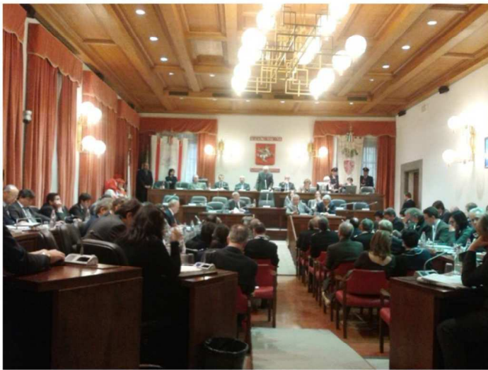
Il consiglio regionale

Il Consiglio regionale ha adottato, con un voto a maggioranza, il Piano paesaggistico che, trascorso il periodo delle osservazioni, tornerà all'attenzione dell'aula per l'approvazione definitiva. L'atto è stato adottato con il voto contrario di Fdl, Udc e Più Toscana-Ncd e quello di astensione di Ncd e Forza Italia. Approvata anche la proposta di risoluzione collegata, su cui ha votato contro il gruppo Nuovo Centrodestra e hanno espresso voto di astensione Fdl e Udc.