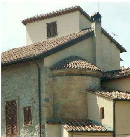
Fig. 11 – Castello di Castelnuovo della M.dia: abside appartenuto all'antica chiesa di S. Stefano e lastra marmorea posta all'inizio della vecchia strada per il Gabbro (già Via di Popogna di origine romana)