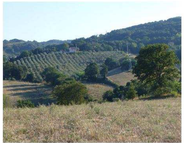
Fig. 10 – Oliveta di Casa Cesari