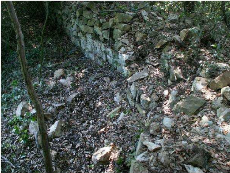
Fig. 13 – Cinta muraria del castello di Motorno (sec. XII)