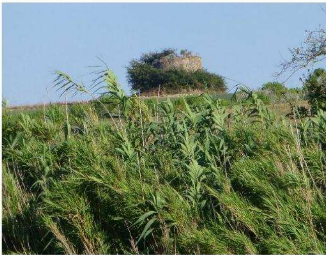
Fig. 7 – Resti del mulino a vento di Collina Alta (inizi sec. XIX)