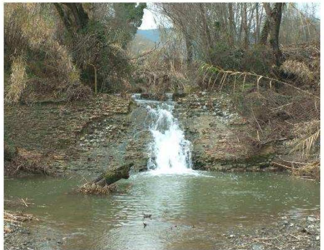
Fig. 8 – Serra del mulino del Chiappino (anno 1700) sull'acqua della Sanguigna