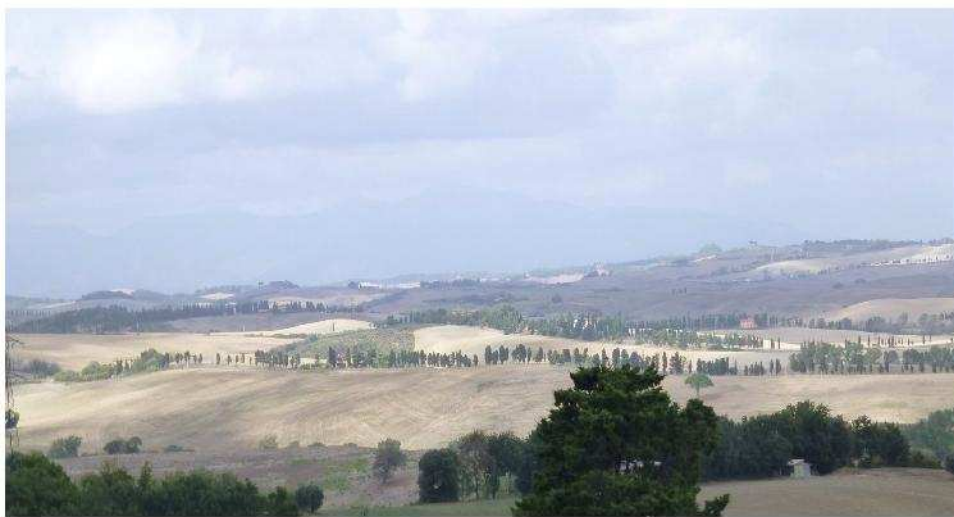
Fig. 2 – Filari alberati in cresta alle colline delle valli Riardo e Sanguigna