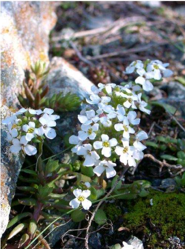
Fig. 15 – Bivonea del Savi (Monte Carvoli)