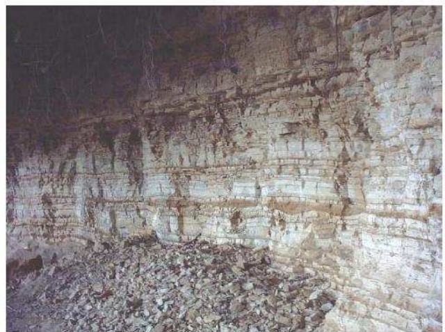
Fig. 16 - “Tripoli” di Paltratico (loc. La Villa)