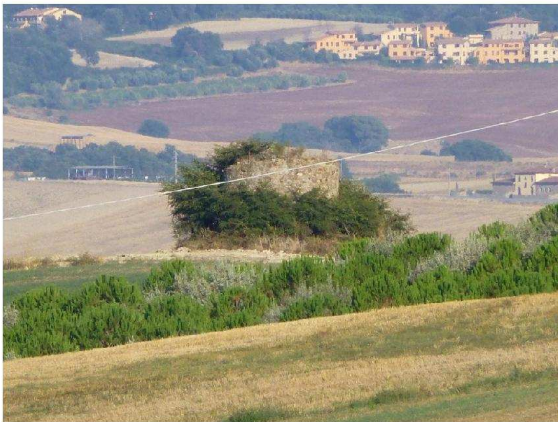
Torre del mulino a vento di Collina Alta (inizi secolo XIX) visto dal Gozzone