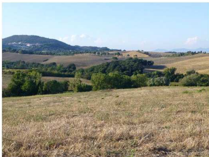
Fig. 3 – Siepi, alberature e macchie di bosco