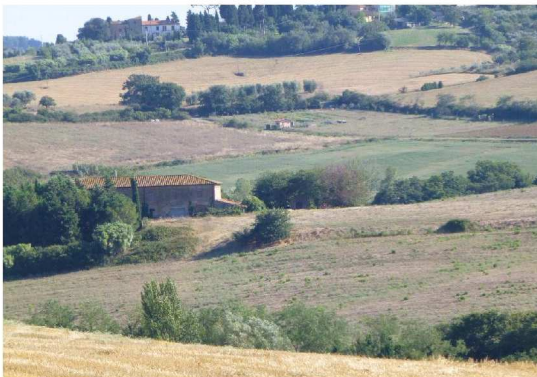
Il fabbricato settecentesco del Gozzone e la collina su cui dovrebbe essere aperta la cava.