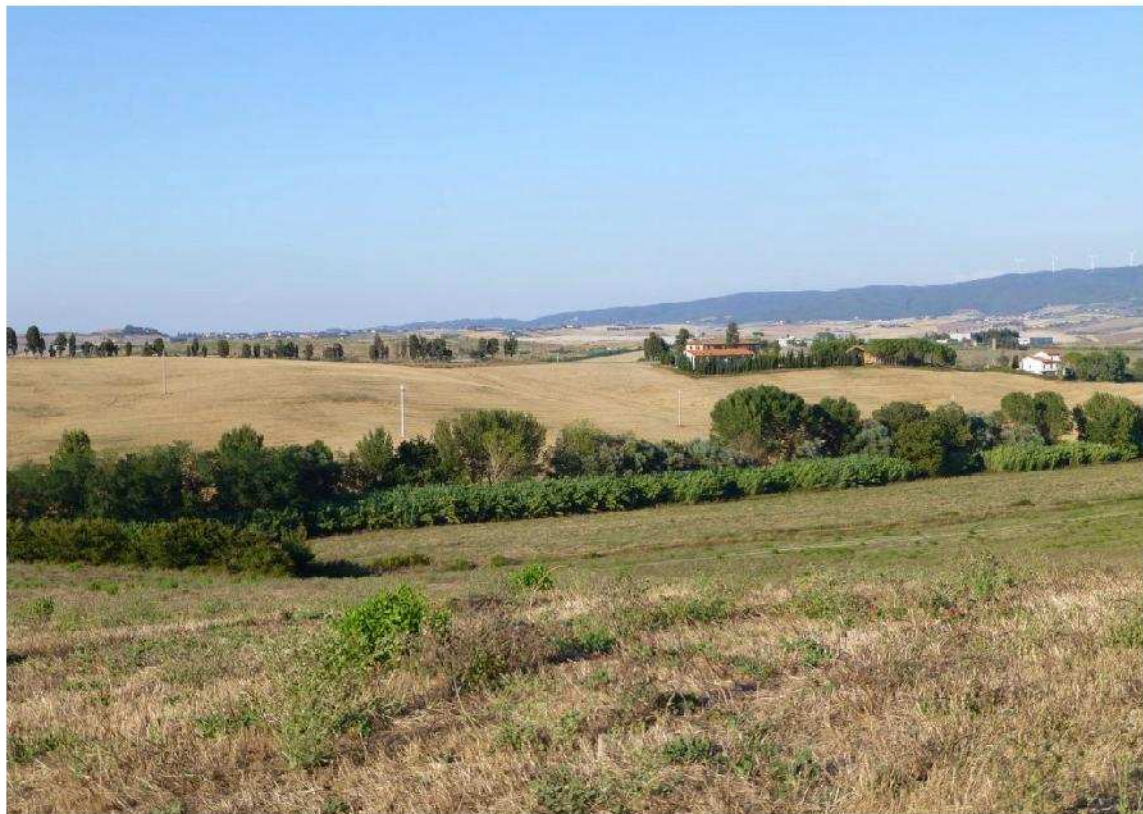
Podere Motorno (sec. XVIII), oltre il Botro Riardo, visto dalla collina del Gozzone