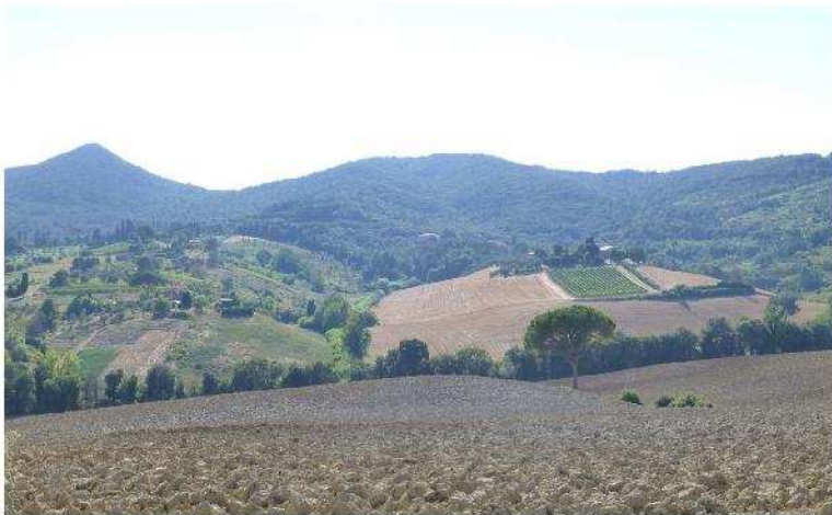
Fig. 9 – Vigneti di Paltratico e Cappellese