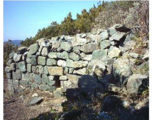
Fig. 14 – Monte Carvoli: fortezza di altura di epoca etrusca