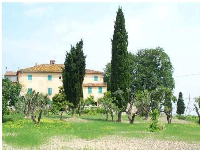
Fig. 4 – Villa di Paltratico (fine sec. XVIII)