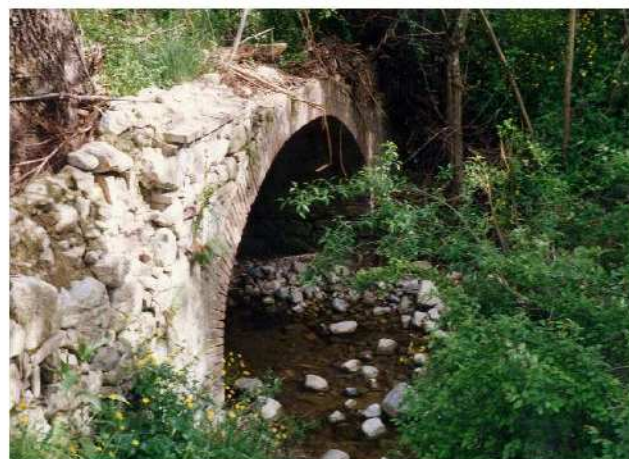
Fig 6 – Ponte sul Botro Riardo (sec. XVIII?)