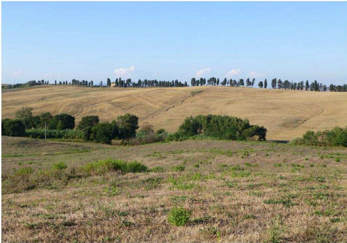
Collina di Casa S. Elena vista dal futuro sito di cava del Gozzone. Si noti il filare di cipressi sul crinale della collina e la vegetazione riparia che riveste il Botro Riardo