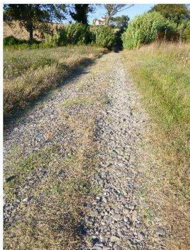
Fig. 1 - Strada acciottolata che supera a "guado" il Botro Riardo in loc. Gozzone