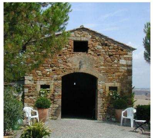
Fig. 12 – Ex-Oratorio di S. Martino (sec. XIII)