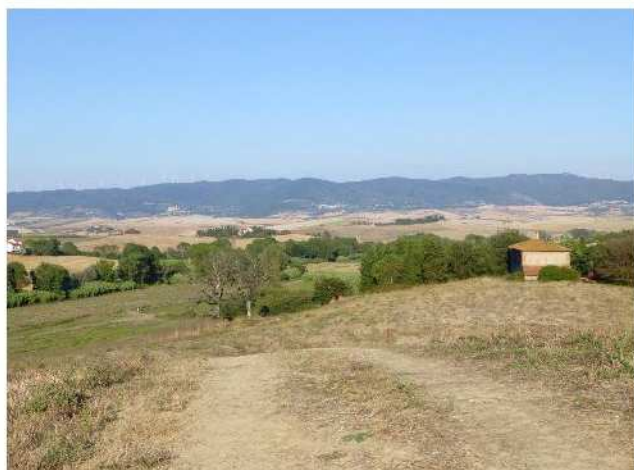
Fig. 5 - Fabbricato del Gozzone (sec. XVIII)